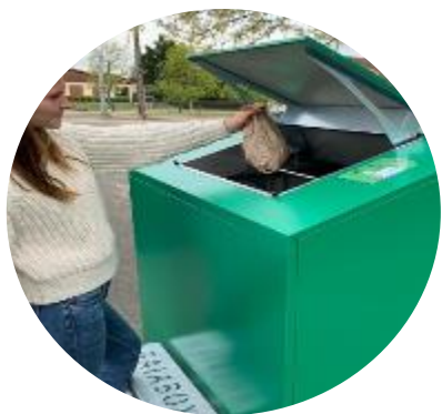
Collecte sélective des biodéchets des ménages (collectivités locales)