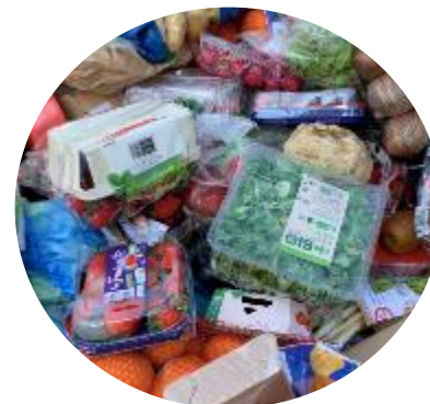
Invendus des GMS (Grandes et moyennes surface) / très emballés