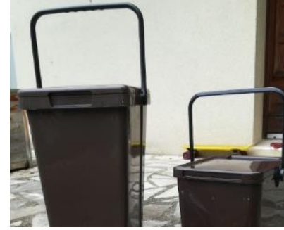
Accessoires de collecte