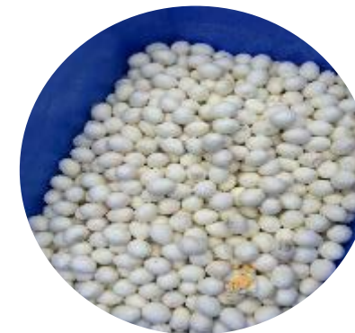
Rebuts de production des industries agro-alimentaires