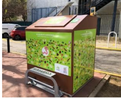
Points d'apport volontaire