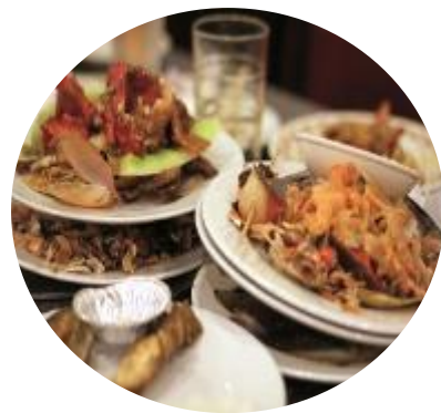
Déchets de RHF (Restauration Hors Foyer)